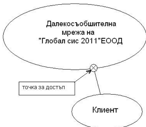
Фигура 1: Предоставяне на услуги през интерфейс Етернет и RLAN

Интерфейсите се използват за осъществяване на свързаност между крайни клиентски далекосъобщителни устройства и мрежата на ГЛОБАЛ СИС НЕТ с цел предоставяне на услуги от страна на “Глобал сис 2011” ЕООД. Тази свързаност се осъществява съгласно Фигура 1: